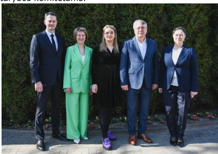
Nuotr. 2023 m. balandžio 22 d. posėdis, frakcija „Kėdainių Liberalai“.

Naujos kadencijos (2023-2027 m.) Kėdainių rajono savivaldybės taryba pradėjo darbą su nauja valdančiąja dauguma. Trijų partijų atstovai – penki Kėdainių liberalai, šeši socialdemokratai ir trys valstiečiai ir žalieji – pasirašė koalicijos sutartį. Valdančiųjų atstovai vadovaus ir penkiems tarybos komitetams.