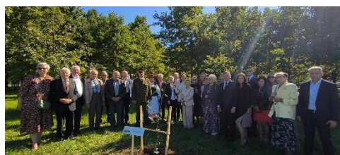
Nuotr. Kėdainių Atgimimo žuolyne pasodintas žuolas, simbolizuojantis gražią Sąjūdžio 35-mečio sukaktį.

2023 m. rugsėjo 16 d. Kėdainiuose vyko Lietuvos Sąjūdžio 35-mečio minėjimo šventė.