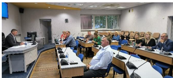
Nuotr. Kėdainių rajono savivaldybės kolegijos posėdis

2023 m. Kolegijos posėdžių metu priimti 5 sprendimai.