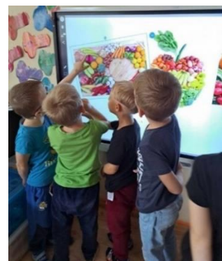
Nuotr. Kėdainių lopšelio-darželio „Puriena“ ugdytiniai

Spalio 25 d. Kėdainių lopšelyje-darželyje „Puriena“ taikomą mąstymo gebėjimų ugdymo metodiką įvertino Jungtinės Karalystės Ekseterio universitetas – lopšeliui-darželiui „Puriena“ suteiktas Mąstymo mokyklos statusas. Lopšelis-darželis tapo ketvirtąja akredituota ikimokyklinio ugdymo įstaiga šalyje. Iš viso šalyje yra 6 tokios akredituotos ugdymo įstaigos.