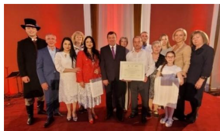
Nuotr. Kėdainių r. Užupės kaimo bendruomenės „Liaudė“ atstovai kartu su Kėdainių rajono savivaldybės delegacija

Gegužės 15 d. Užupės kaimo bendruomenei „Liaudė“ už unikalios Velykų tradicijos puoselėjimą įteiktas pripažinimo sertifikatas.