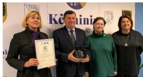
Nuotr. Kėdainių rajono savivaldybės vadovai su gautu apdovanojimu ELoGE

Lapkričio 16 d. Lietuvos Respublikos vidaus reikalų ministerijoje iškilmingų apdovanojimų metu Kėdainių rajono savivaldybė apdovanota Europos ženklu už nepriekaištingą demokratinį valdymą pagal 12 Europos Tarybos demokratinio valdymo principų procesą (ELoGE).