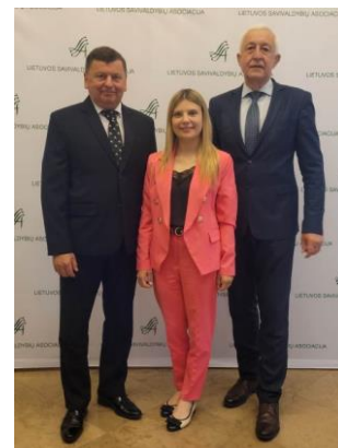
Nuotr. Kėdainių rajono savivaldybės delegatai LSA visuotiniame suvažiavime

Suvažiavimo metu buvo sprendžiami organizaciniai klausimai, renkamas Lietuvos savivaldybių asociacijos prezidentas, viceprezidentai, priimta rezoliucija dėl Regionų plėtros programos įgyvendinimo.