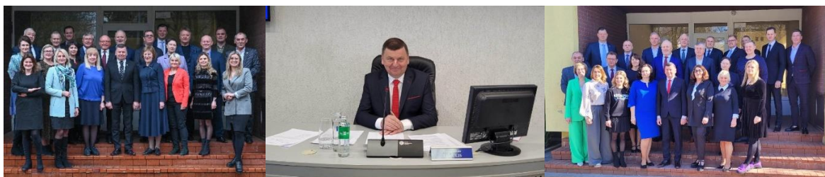
Nuotr. Kėdainių rajono savivaldybės tarybos posėdžiai.

2023 m. vadovaudamiesi Lietuvos Respublikos teisės aktais ir laikydamiesi Kėdainių rajono savivaldybės tarybos veiklos reglamento nuostatų, Tarybos nariai svarstė 401 sprendimų projektą ir priėmė 389 Tarybos sprendimus.