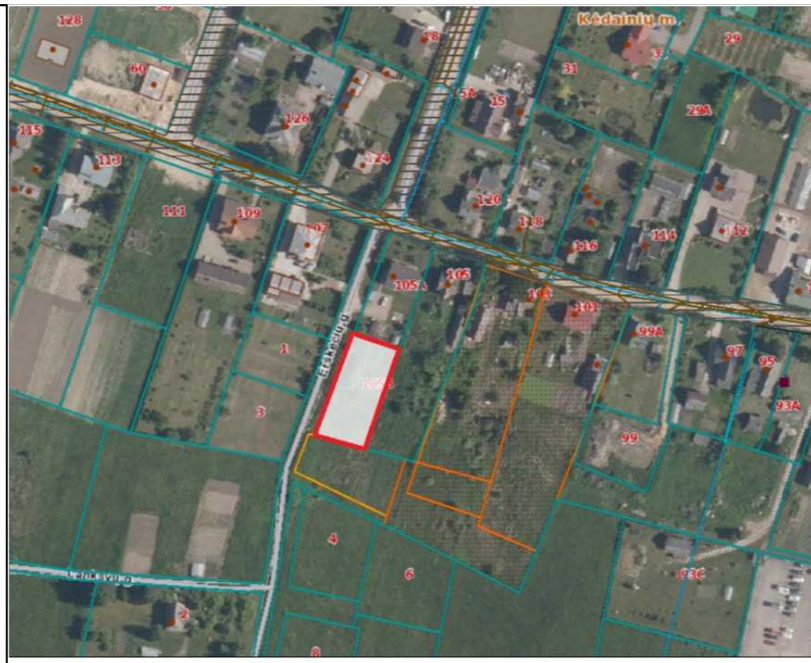
FRAGMENTAS IŠ WWW.REGIA.LT