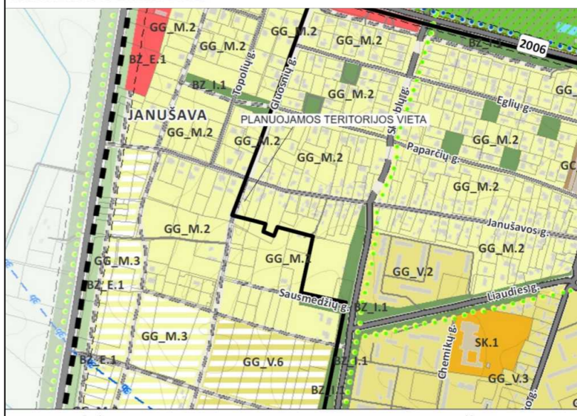
FRAGMENTAS IŠ KĖDAINIŲ MIESTO BENDROJO PLANO SPRENDINIŲ KOREGAVIMO PAGRINDINIO BRĖŽINIO