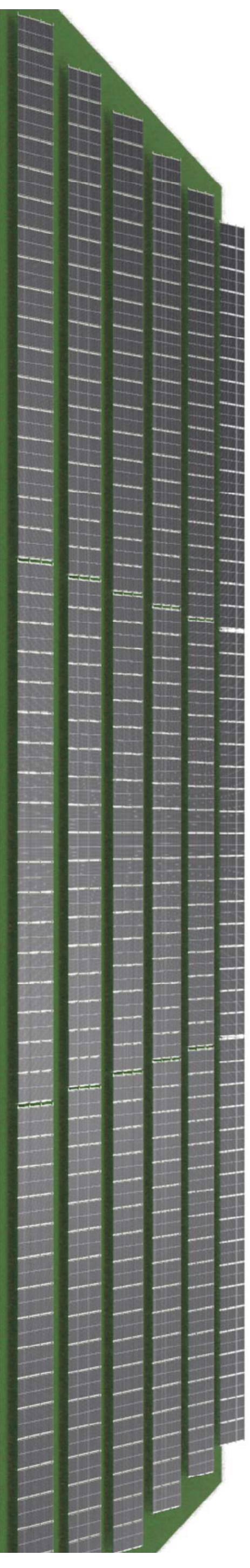
VIZUALIZACIJA - 2.